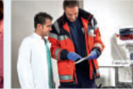
Zentrale Notaufnahme (ZNA)