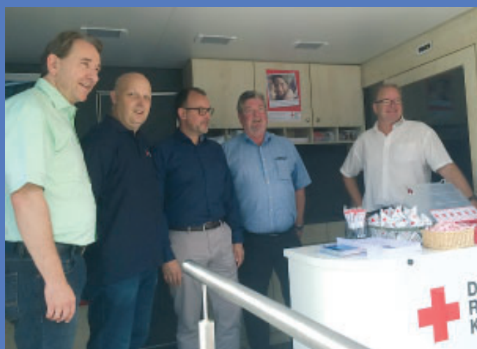
Zur Besichtigung und Information waren außerdem das Blutspendemobil des BSD West und das Rollstuhlmobil des Kreisverbandes Bad Ems vor Ort, die sich des regen Interesses der Diezer Bevölkerung erfreuten.