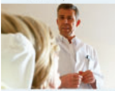
Unfallchirurgie und Orthopädie