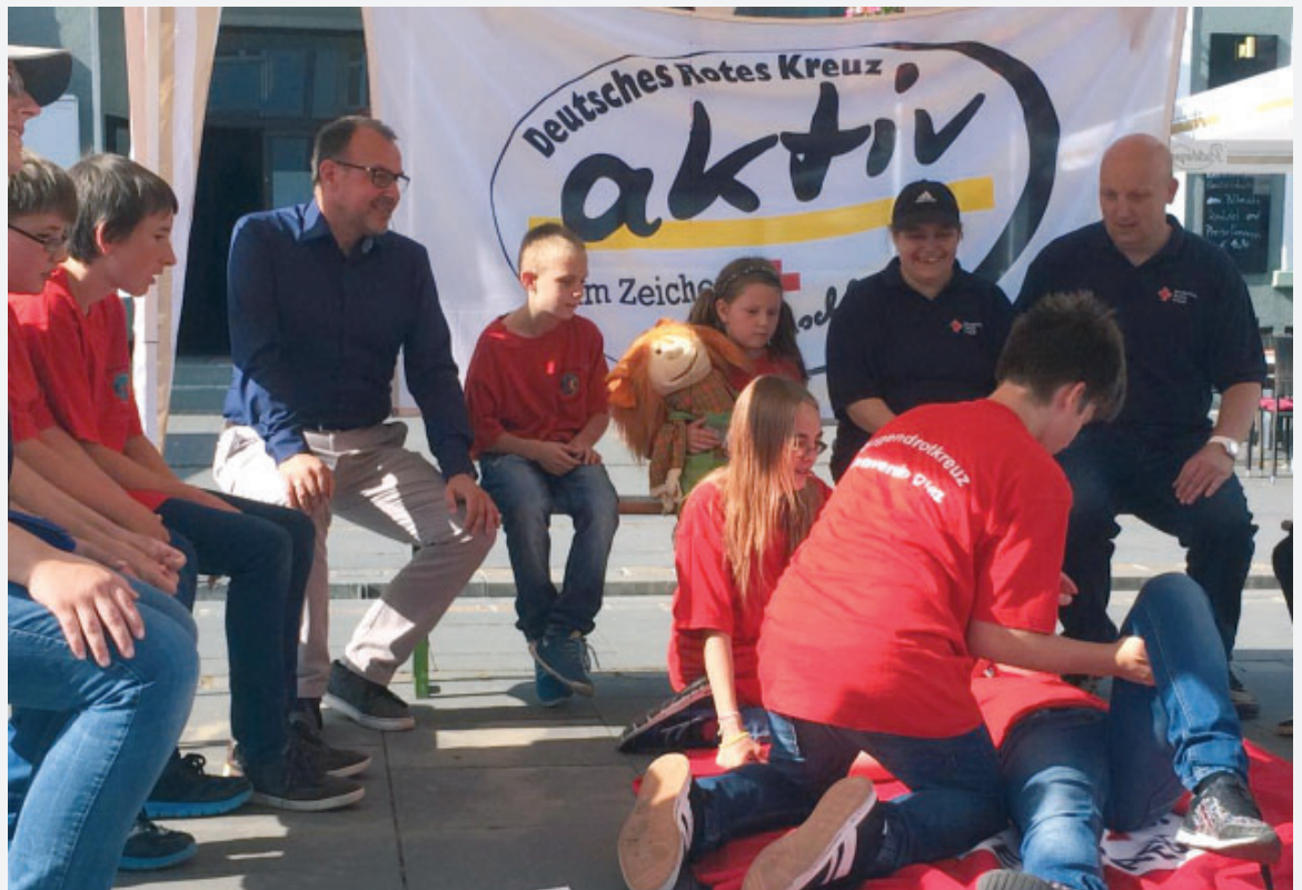
125 Jahre DRK-Ortsverein Diez und Umgebung