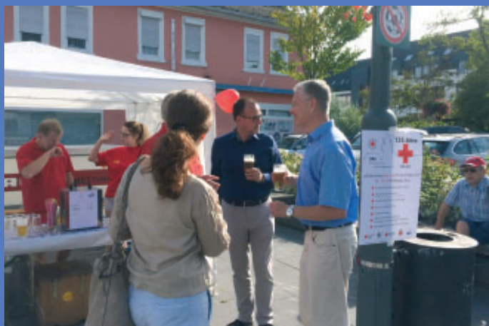
Die Bereitschaft und der Sozialdienst informierten in vielen Gesprächen die Bevölkerung über ihr vielfältiges Engagement im Verein.