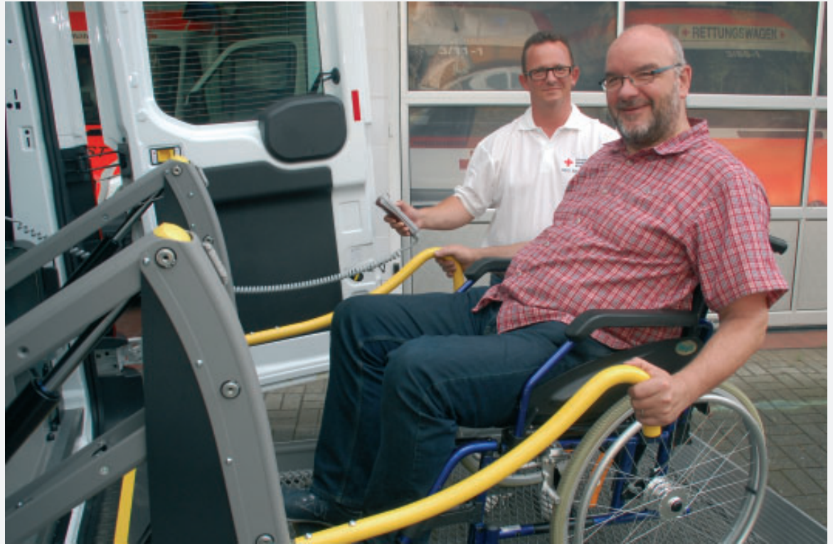
Das Rote Kreuz im Rhein-Lahn-Kreis weitet sein soziales Angebot aus