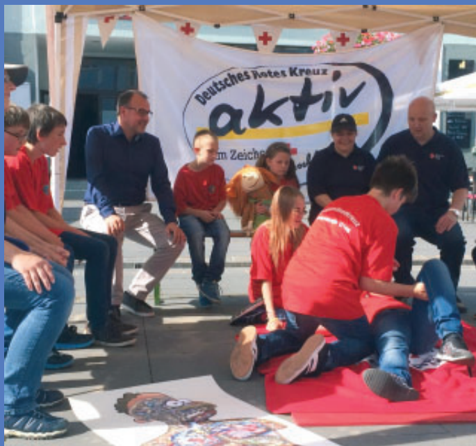
Das JRK beeindruckte mit Vorführungen aus der Ersten Hilfe: Hier sieht es nicht so gut aus für den „Verletzten“, doch nach einem Gesundheitscheck bringen die jungen Helfer den Patienten fachgerecht in die stabile Seitenlage.