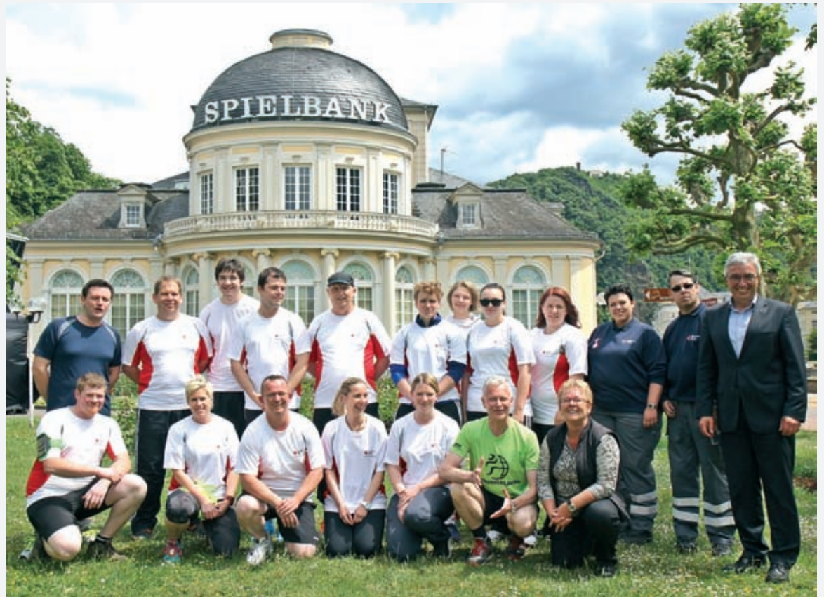
Flagge zeigen für Menschen unserer Heimat