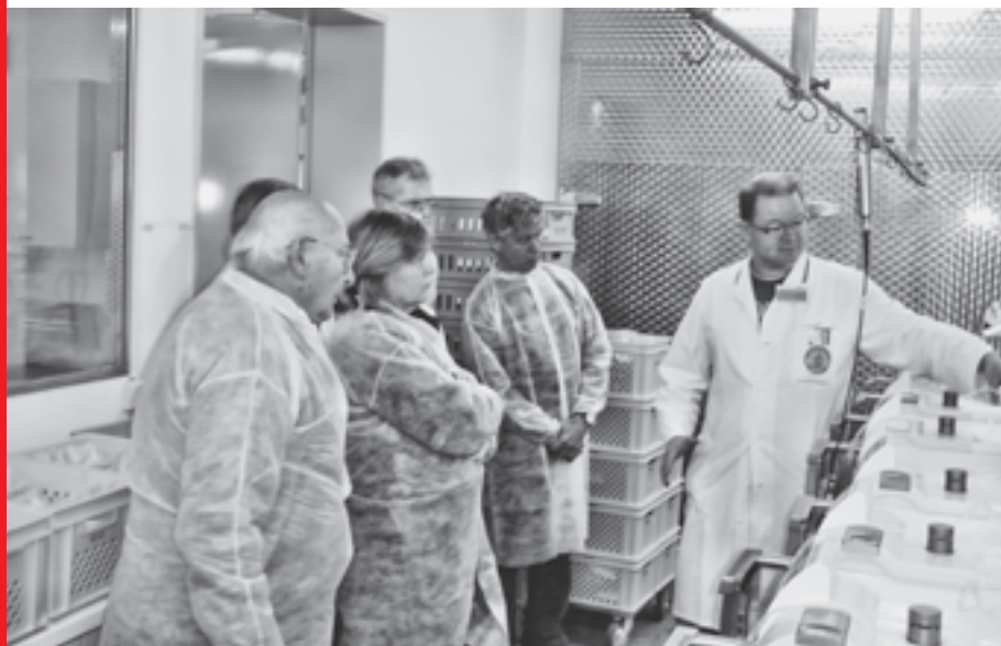
Das Spenderblut wird in seine Bestandteile zerlegt. Moderne Technik kommt hier zum Einsatz.

Weitere Informationen über das Blutspenden und den Blutspendedienst findet man im Internet unter www.blutspendedienst-west.de . Übrigens: aktive Blutspender findet man unter www.blutspender.net .