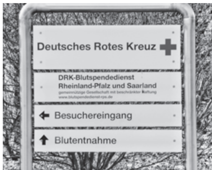
Das Ziel unserer Fahrt ist erreicht.

Nach sorgfältiger Bearbeitung entstehen aus einer Blutspende folgende Blutprodukte: Erythrozytenkonzentrat Plasma und Buffy coat (Thrombozyten und Leukozyten sowie Restmengen von Plasmas und Erythrozyten). Parallel zur Herstellung der Blutprodukte werden im Zentrallabor Hagen die gesetzlich vorgeschriebenen Testungen des Spenderblutes auf wichtige Infektionskrankheiten durchgeführt. Sind diese unauffällig, gelangen die hergestellten Blutprodukte in die Etikettierung und bekommen dort noch ein Etikett mit der Blutgruppe